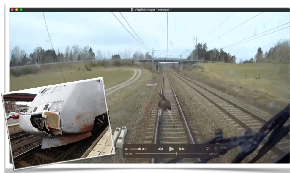
Bild ur en filmsekvens som spelades in i April 2015. Älgen var på väg tvärs över järnvägen, upptäckte tåget mycket sent trots varningssignaler från lokföraren. Älgen började då springa längs med spåret i stället för rätta sig genom att fortsätta rakt över spåret. Tåget (X2000) körde med nästan 200 km/h och fick fronten förstörd.

Under 2010-2012 har SJ betalat årligen ca 35 miljoner kronor för reparationer av lok som skadades vid viltpåkörningar. Därtill kommer kostnader för trafikstörningar och förseningar, för rensning av järnväg, kontroll och eftersök, samt hantering av olyckshändelsen hos både Trafikverket och Tågoperatören. Enskilda olyckshändelser kan därmed lätt skapa en kostnad på över 1 miljon kronor för samhället. Vi uppskattar att viltpåkörningar på järnväg kostar samhället drygt 1 miljard kronor varje år. I takt med att nyare och känsligare tågssystem tas i bruk och tågtrafiken ökar måste vi räkna med en tydlig ökning i antal av och kostnader för viltpåkörningar.